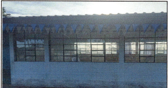
Foto 4: APLICACIÓN DE PINTURA EN PADERES, DE AULAS Y DIRECCIÓN; INTERIORES Y EXTERIORES