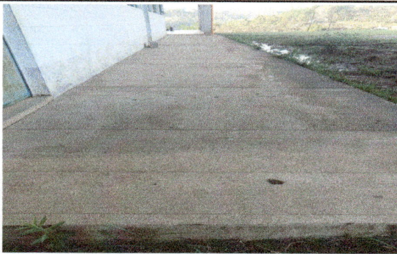
Foto 3: SUSTITUCIÓN DE PISO POR PISO CERAMICO, CORREDOR DE AULAS.