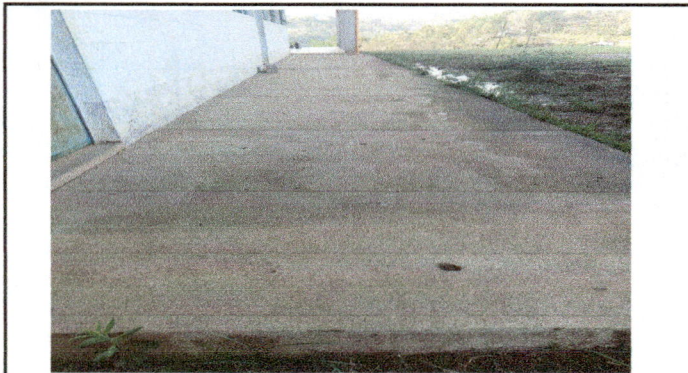
Foto 3: SUSTITUCIÓN DE PISO POR PISO CERAMICO, CORREDOR DE AULAS.