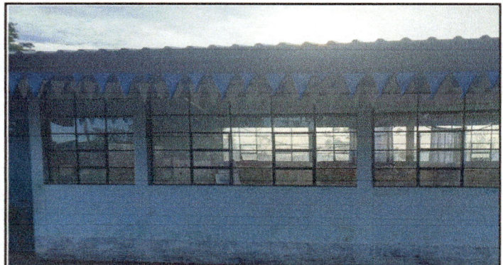
Foto 4: APLICACIÓN DE PINTURA EN PADERES, DE AULAS Y DIRECCIÓN; INTERIORES Y EXTERIORES