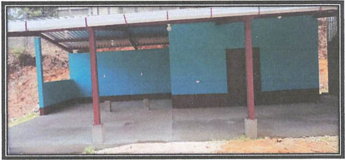
Foto 6: Finalización de la remodelacion de cocina EOUM "Oxlajuj No'j" Asi quedó la culminacion.

Observación: Si es necesario se pueden agregar hojas adicionales y actualizar el número de hojas.