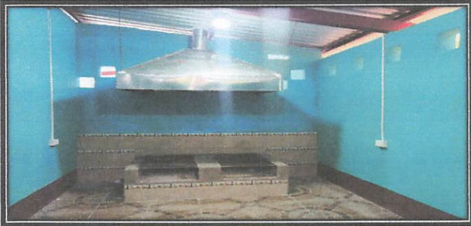
Foto 3: Finalizacion de remodelacion en pintado, alumbrado y azulejeado.