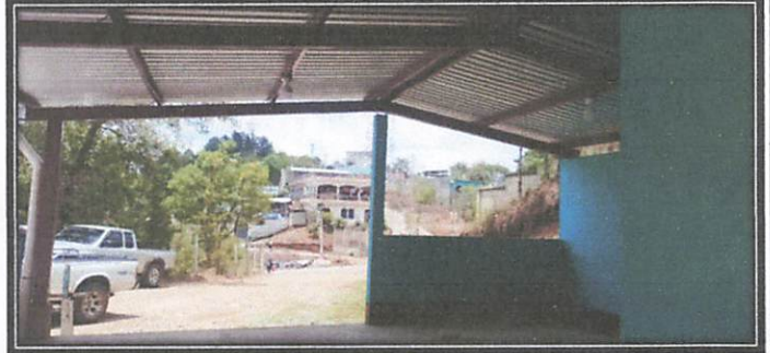
Foto 2: Corredor amplio y techado con energia electrica exteriores.