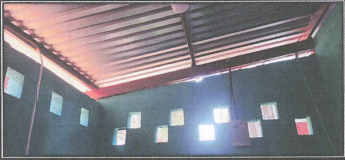
Foto1: Insalacion de energia electrica dentro de la cocina.