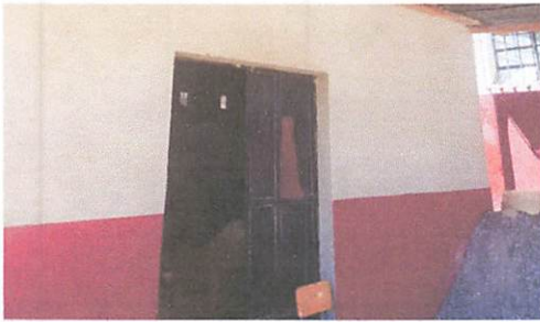
Foto 3: SE NECESITA MANTENIMIENTO EN PUERTA, CAMBIO DE CHAPA Y PINTADA,