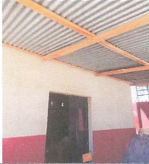
Foto 1: SE NECESITA CAMBIAR ESTRUCTURA PORTANTE DE METAL Y TECHADO DE LAMINA