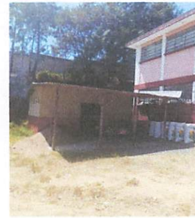
Foto 4: SE NECESITA REPARACION TORTA DE CONCRETO PARA AREA DE SERVICIO.