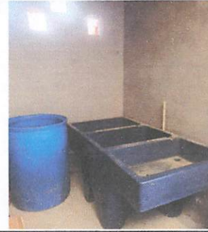
Foto 2: SE NECESITA PISO ANTIDESLIZANTE Y AZULEJO EN AREA DE LAVABO