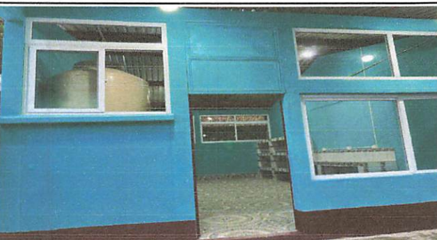
FOTO 11: PRESENTACION VISTA FRONTAL DE CULMINACION DE PROYECTO DE COCINA.