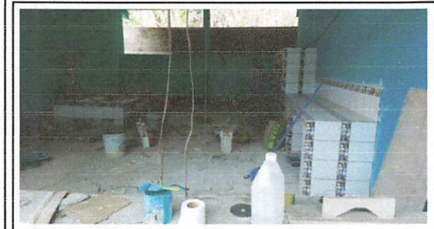
Foto 3: NECESARIO LA CONSTRUCCION DE POLLON PARA LA PREPARACION DE ALIMENTOS.