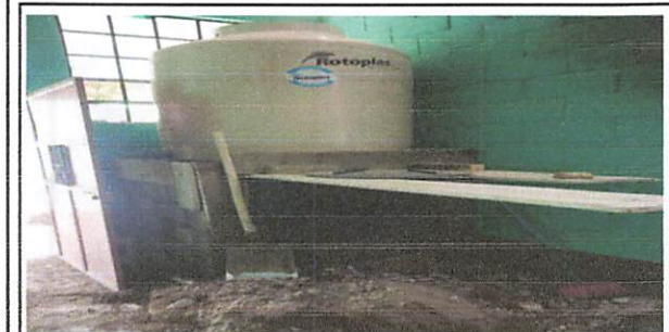
Foto 5: SUSTITUCION BASE APOYO DE DEPÓSITO PARA AGUA, CONSISTE EN FUNDICION DE LOSA DE CONCRETO.