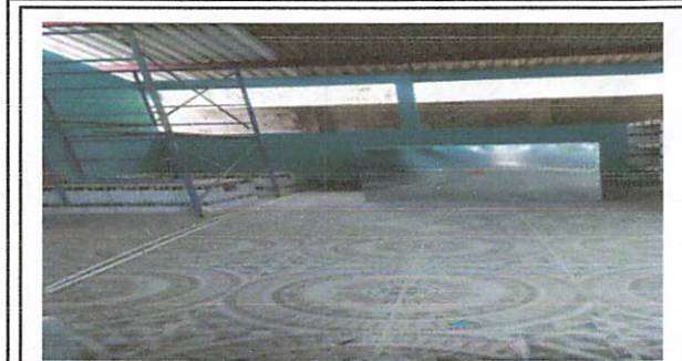
Foto 1: SE ESTÁ LLEVANDO EL PROCESO DE CAMBIO DE PISO EN LA COCINA