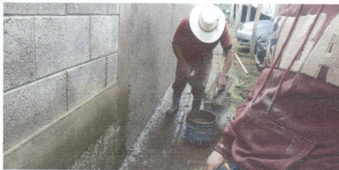
Fotografía No. 5: Problema de filtración de agua hacia la escuela, pared de la parte posterior donde se origina el problema.