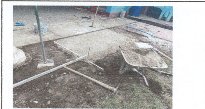
Fotografía No.9: Deterioro de torta de cemento del patio de juegos de la Escuela Oficial De Párvulos.