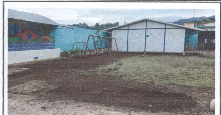
Fotografía No. 8: Sustitución de piso de torta de cemento por adoquin apto para el uso de la población escolar del establecimiento.