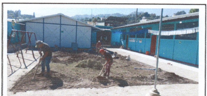
FOTO 12: Deterioro de torta susutituido por adoquin, acumulación de agua

Observación: si es necesario se puede agregar hojas adicionales y actualizar el numero de hojas.