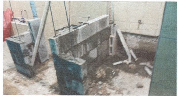
Fotografía No. 2: Necesidad de dos servicios sanitarios para varones ya que los existentes son insuficientes para la población escolar.