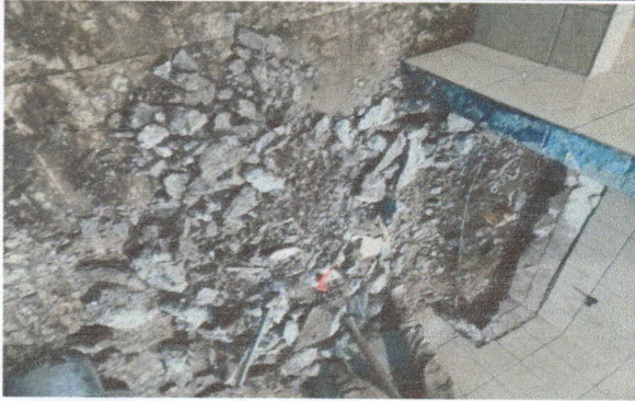
Fotografía No. 1: Ampliación de dos servicios sanitarios para varones.