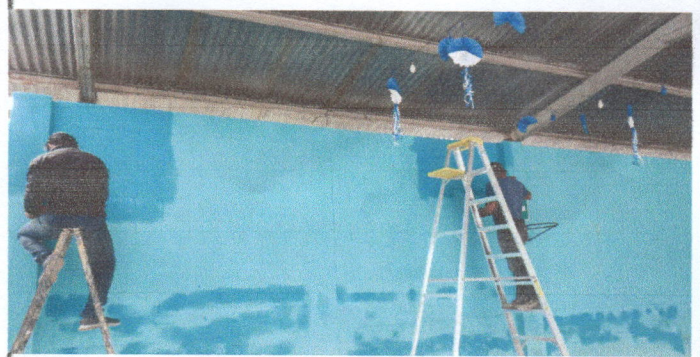
Fotografía No. 4: Filtración de agua pluvial en pared de la escuela que causa moledias y enfermedades a la población escolar.