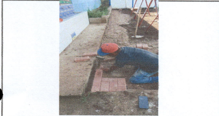
Fotografía No. 7: Fractura del piso de torta de cemento en el patio de la escuela de uso de la población escolar.