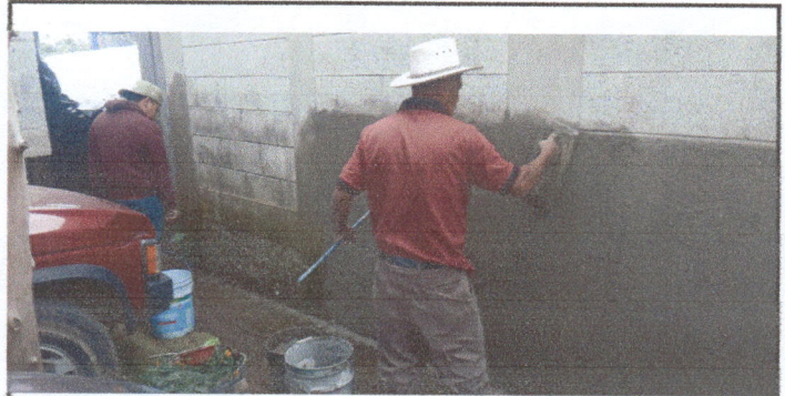
Fotografía No. 6: Necesidad de canales y bajada de agua pluvial, impermeabilización de pared para evitar la continuidad del daño por filtraciones.

Observación: Si es necesario se pueden agregar hojas adicionales y actualizar el número de hojas.