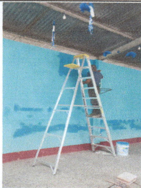
Fotografía No. 3: Impermeabilización de paredes interior y exterior ya que debido a la filtración causa inundación dentro de la escuela.