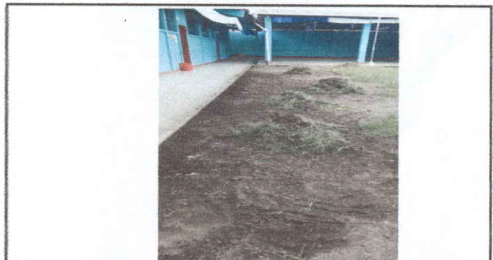
Fotografía No. 10: Mal estado de la cobertura de cemento del patio de la Escuela De Párvulos, debido a las lluvias.