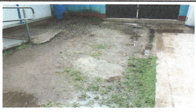
Fotografía No. 8: Sustitución de piso de torta de cemento apto para el uso de la población escolar del establecimiento.