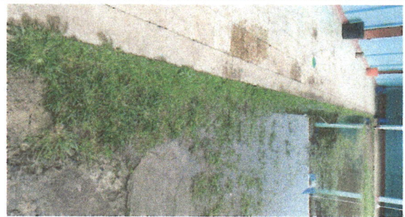
FOTO 12: Deterioro de torta sustituido por adoquín, acumulación de agua.

Observación: si es necesario puede agregar hojas adicionales y actualizar el número de hojas.