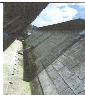
Fotografía No. 6: Necesidad de canales y bajada de agua pluvial, impermeabilización de pared para evitar la continuidad del daño por filtraciones.

Observación: Si es necesario se pueden agregar hojas adicionales al número de hojas.