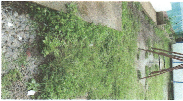
Fotografía No.9: Deterioro de torta de cemento del patio de juegos de la Escuela Oficial De Párvulos.