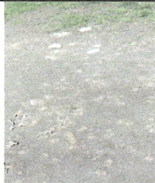
Fotografía No. 10: Mal estado de la cobertura de cemento del patio de la Escuela De Párvulos, debido a las lluvias.