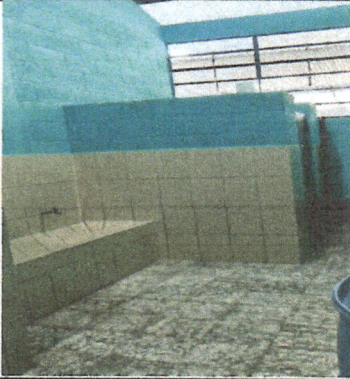
Fotografía No. 1: Ampliación de dos servicios sanitarios para varones.