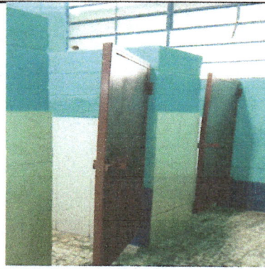
Fotografía No. 2: Necesidad de dos servicios sanitarios para varones ya que los existentes son insuficientes para la población escolar.