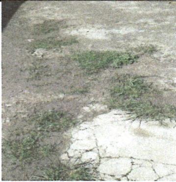
Fotografía No. 7: Fractura del piso de torta de cemento en el patio de la escuela de uso de la población escolar.