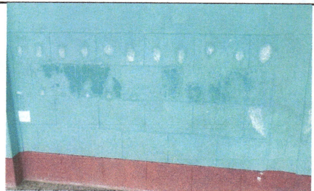
Fotografía No. 4: Filtración de agua pluvial en pared de la escuela que causa moledias y enfermedades a la población escolar.