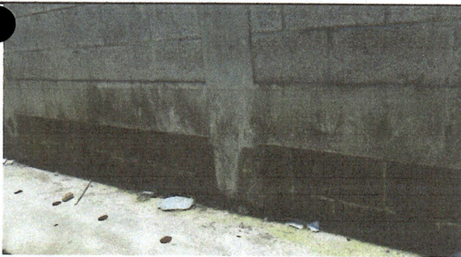
Fotografía No. 5: Problema de filtración de agua hacia la escuela, pared de la parte posterior donde se origina el problema.