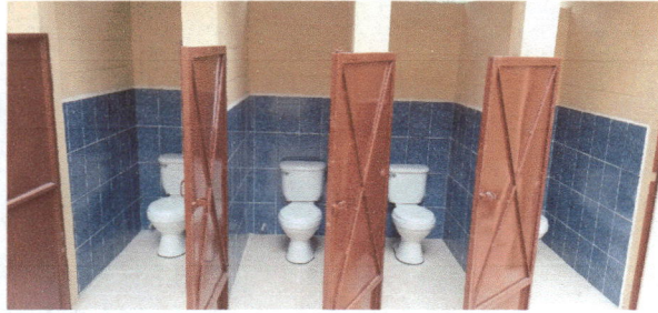
Foto1: Colocación de sanitarios lavables