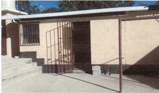
Foto7: Rrelleno de la cocina movido y con baranda puesta