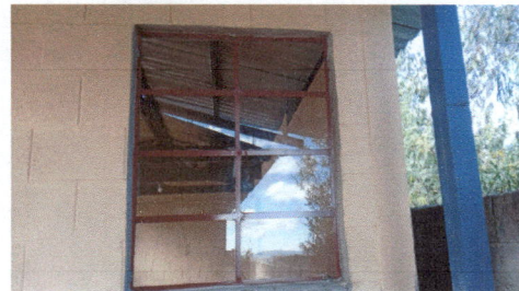
Foto 6: Construcción de una ventana para la iluminación en la cocina

Observación: Si es necesario se pueden agregar hojas adicionales y actualizar el número de hojas.