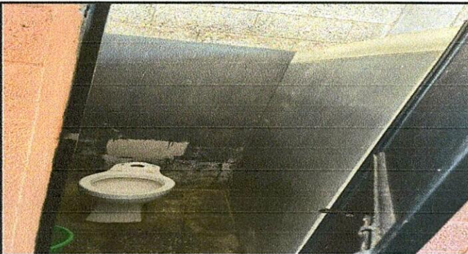
Foto 5: MODULO #4 SANITARIOS EN MAL ESTADO, SUSTITUIR POR SANITARIO TIPO PUSH + ACCESORIOS