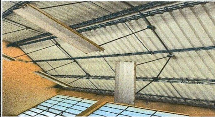
Foto1: MODULO #1: AULAS SIN ILUMINACION, ES NECESARIO NUEVA INSTALACION USANDO PLAFON Y BOMBILLAS LED.