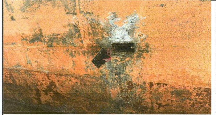
Foto 2: MODULO #1 TOMACORRIENTE EN MAL ESTADO, ES NECESARIO NUEVA INSTALACION Y CABLE CALIBRE No.12.