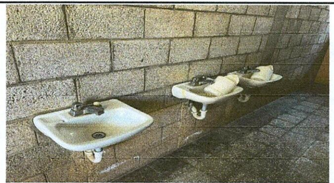
Foto 6: SUSTITUIR LAVAMANOS POR LAVAMANO DE CONCRETO ARMADO Y AZULEJO, Y SUSTITUCION DE PISO POR PISO ANTIDESLIZANTE, COMO APLICACION DE PINTURA EN PAREDES.

Observación: Si es necesario se pueden agregar hojas adicionales y actualizar el número de hojas.