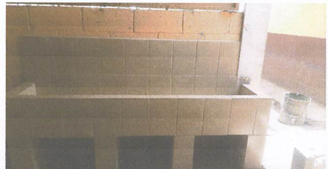
Foto 6: lavamanos para sanitario modulo 2 he instalacion de tubo PVC de chorros

Observación: Si es necesario se pueden agregar hojas adicionales para indicar el número de hojas.