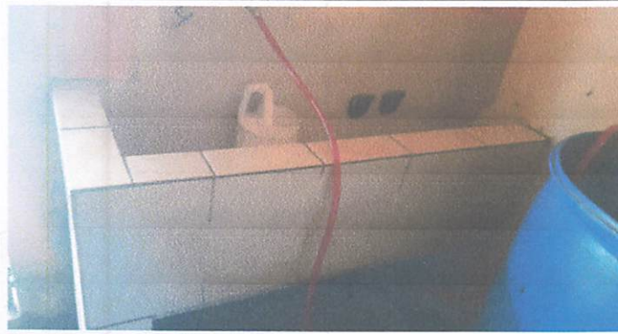
Foto 3: seguimiento de lavamanos armable de concreto e instalacion de tubo PVC co chorros para el vital liquido.