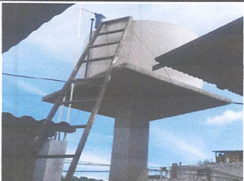
Foto 5: Deposito de agua potable e instalacion de tuberia PVC parab servicio sanitarios.