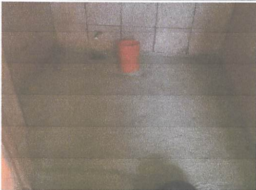
Foto1: instalacion de los nuevos inoidoros push y la reoparacion de la tuveria.