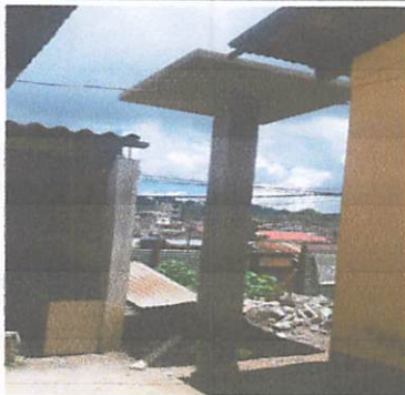
Foto 5: colocacion y arreglo de base para deposito de agua potable e instalaciones fe tubo PVC.