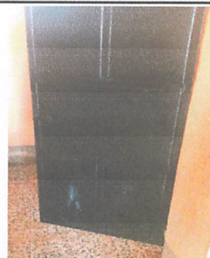
Foto 4: ES NECESARIO EL MANTENIMIENTO DE PUERTAS EN EL SERVICIO SANITARIO MODULO 1