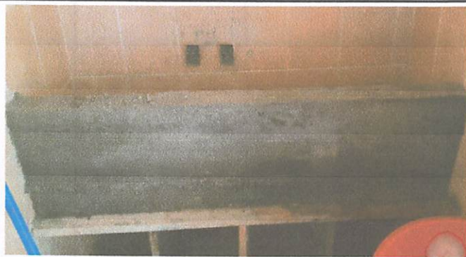
Foto 3: REPARACION DE LAVAMANOS DE CONCRETO ARMABLE + INSTALACION DE 2 CHORROS (instalacion en visto)