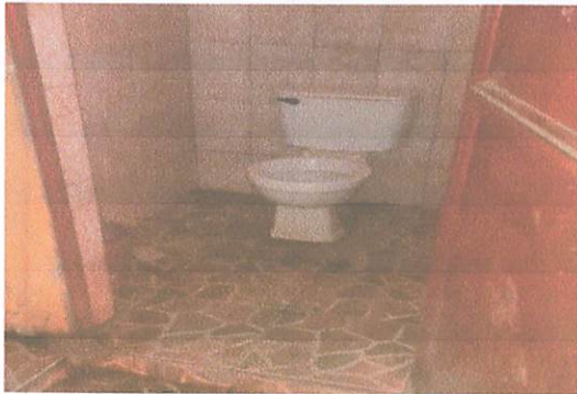
Foto1: sanitario obsoletos ,cambio a inodoro tipo push y una nueva instalacion de tubo PVC 1/2 ( instalacion en visto ) para el abastamiento de sanitarios y lavamanos en el modulo #1.