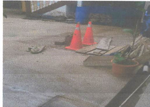
Foto 2: Línea de agua no aprovechable, surge la necesidad de depósito subterráneo alimentado de esta acometida de agua potable, y a su vez servirá para alimentar depósito aéreo de 2500 LT.