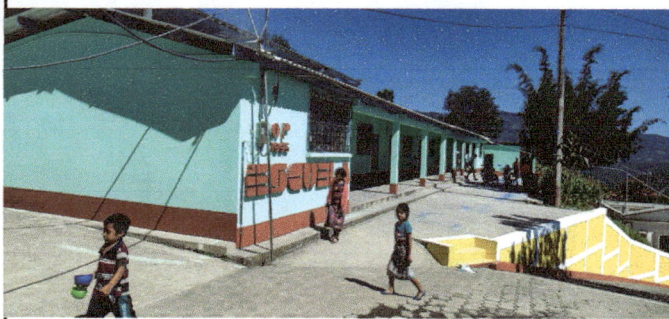
FOTO INSTALCIONES DESPINTADO