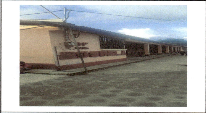
FOTO INSTALCIONES DESPINTADO