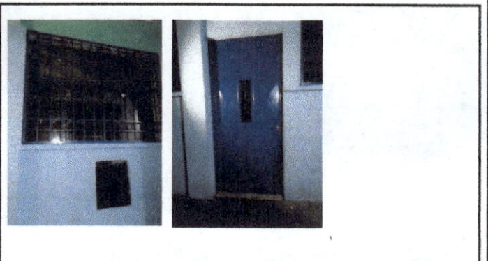
Foto 4: Sumistro e instalación de balcones para protección de ventanas, mantenimiento de puertas, lijado y pintado