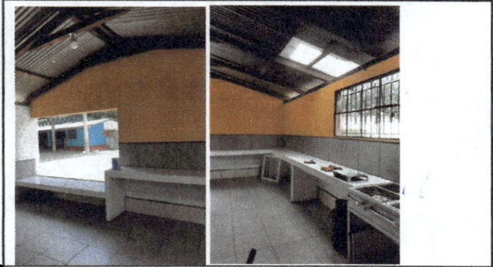
Foto1: Finalización de renglones de trabajo en cocina, suministro e instalación de azulejo y cerámico + pintura + estantes + poyos de cocina