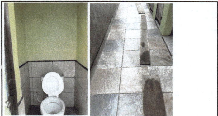
Foto 3: Servicios sanitarios pintados y con azulejo y piso cerámico instalado interior y exterior, reparación de circuito de tubería de agua potable