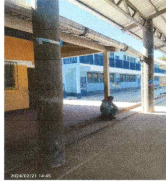
Foto 2: CANAL EXISTENTE CON FALTA DE REFUERZO Y REMACHES EN TRASLAPES, SE NECESITA APLICAR SIKAFLEX EN TRASLAPES DE CANAL.