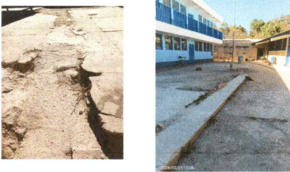
Foto 3: REPARACION DE PLANCHA DE CONCRETO A COLOCACION DE ADOQUIN.