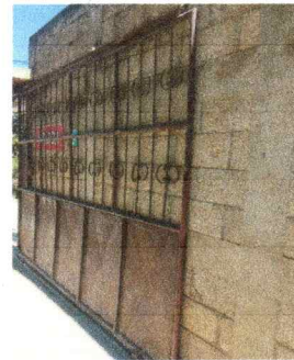
Foto 4: PORTON DE INGRESO EN MAL ESTADO. SE NECESITA CAMBIO DE PORTON.