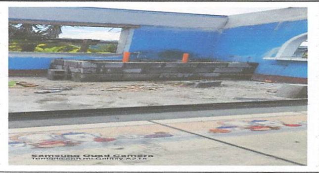
Foto 6: Fabricación de pila para agua con dos lavaderos con azulejo de 1.70 x 1 metro y de 0.80 metro de altura

Observación: Si es necesario se pueden agregar hojas adicionales y actualizar el número de hojas.