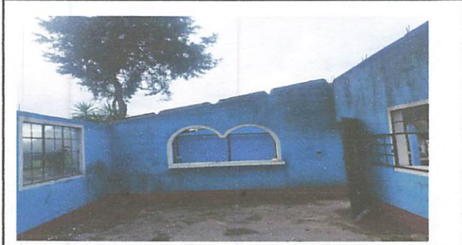
Foto1: Sustitucion de Techo de cocina con lamina Troquelada Alucincal calibre 26