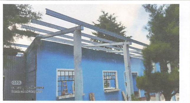
Foto 2: Sustitucion de estructura de techo de cocina con tubos galvanizada de 4x4 y 2x4 chapa 16