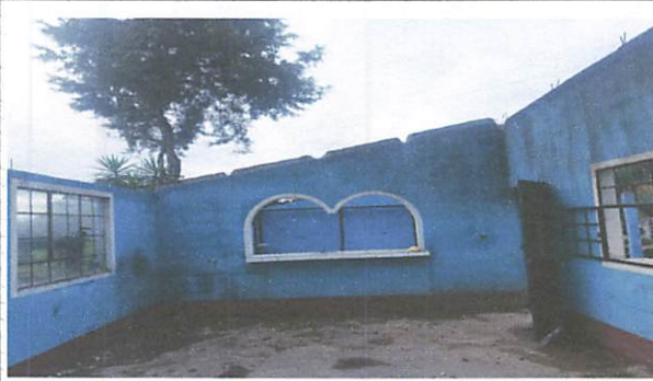
Foto 7: Sustrucción de ventana de cocina de correrizo de 1.5x1.07 metros