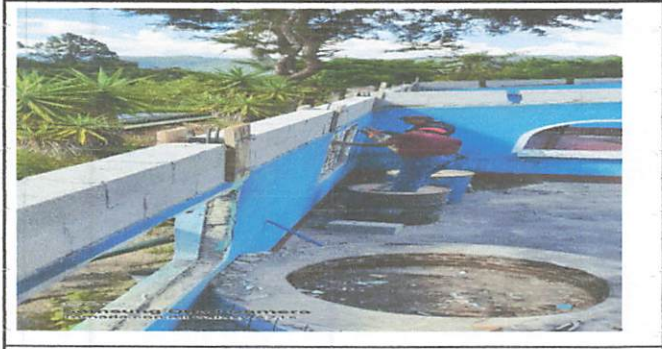
Foto 5: Mantenimiento de pollo de cocina con chimeneas de concreto