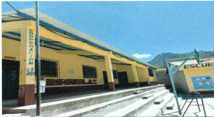
Foto1: Instalación de canales metálicos para agua pluvial