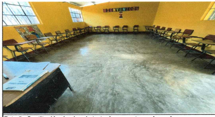
Foto 5: Sustitución de piso de torta de concreto en dos aulas y una bodega