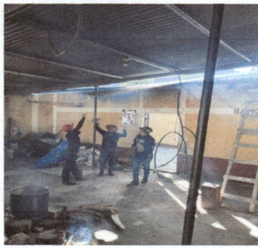
Aquí estan en el proceso de remozar las puertas y el arreglo del cableado eléctrico