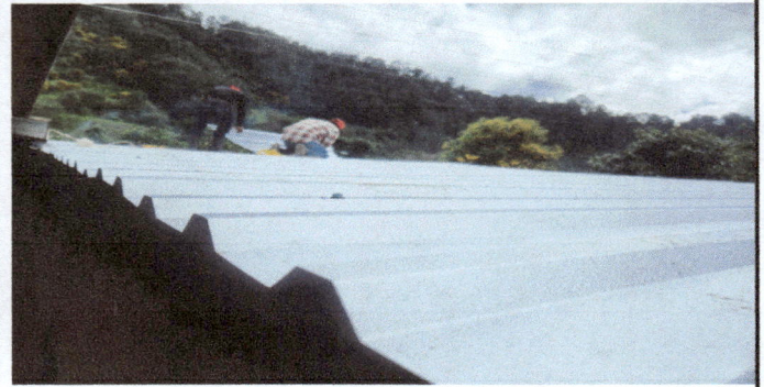
Techado estan colocando las láminas en el área de cocina