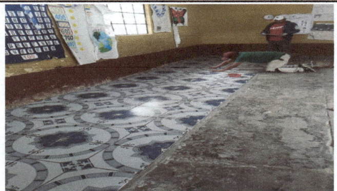
Aquí se está instalando piso cerámico antideslizante en las aulas