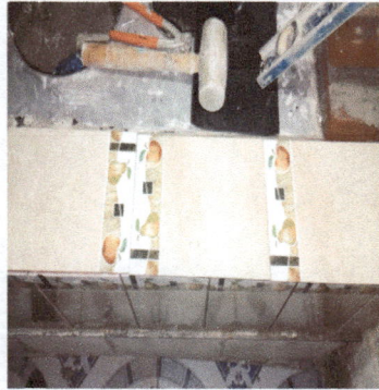
En este trabajo se esta realizando la sustitución de estufa mejorada, en donde se ve el pegado de azulejo