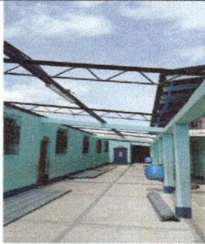
Foto 1: Suministro de material y mano de obras para Sustitución de techo de lámina galvanizado por, Torquelado alucinc calibre 26