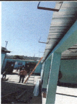
Foto 3: Suministro de material para instalación de bajadas pluviales.