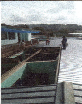
Foto 5: Suministro de material y mano de obras para instalación de capote.