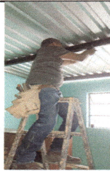
Foto 4: Suministro de material y mano de obras para sustitución de sistema eléctrico, consistentes en cableado y entubado.