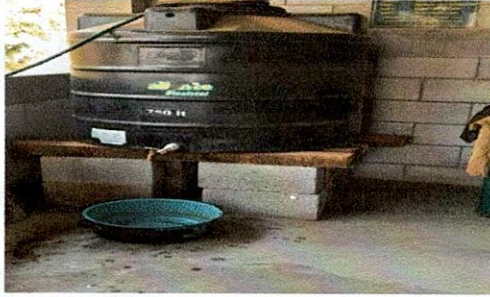
Foto1: construccion de pila