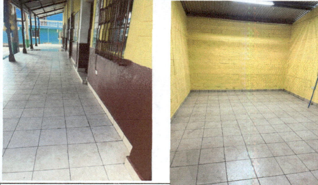
Foto1: Piso cerámico nuevo en corredor de las 2 aulas e interior de dirección.