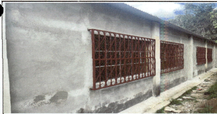
Foto 5: Balcones nuevo y cernido terminado en las 2 aulas y direccion.