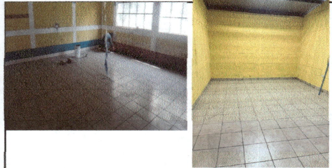
Foto 2: proceso de instalación de piso cerámico en 2 aulas y dirección.