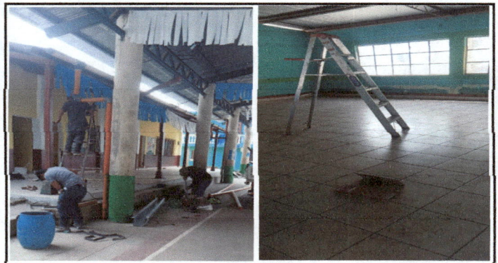
Foto 4: proceso de instalación de canales nuevos e instalación de tomacorrientes y lámparas led.