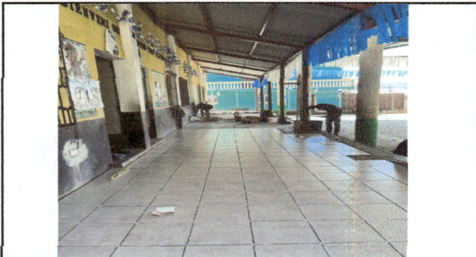
Foto1: proceso de instalación de piso cerámico en corredor salon de clase.