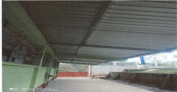
Foto 2: ESTRUCTURA PORTANTE TIPO JOIS OXIDADOS, SERA SUSTITUIDO CON COSTANERA GALVANIZADA + 3 TIJERAS CON TUBO DE 2 "X4" GALVANIZADA