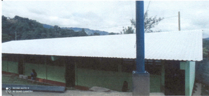
Foto 1: CUBIERTA DE LAMINA DETERIORADO, ES NECESARIO CAMBIO DE TETECHO DE LAMINA.