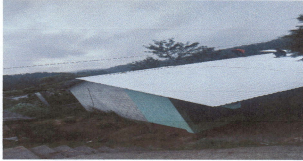
Foto 1: CUBIERTA DE LAMINA DETERIORADO, ES NECESARIO CAMBIO DE TETECHO DE LAMINA.