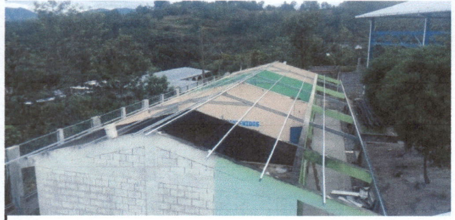
Foto 2: ESTRUCTURA PORTANTE TIPO JOIS OXIDADOS, SERA SUSTITUIDO CON COSTANERA GALVANIZADA + 3 TIJERAS CON TUBO DE 2 "X4" GALVANIZADA