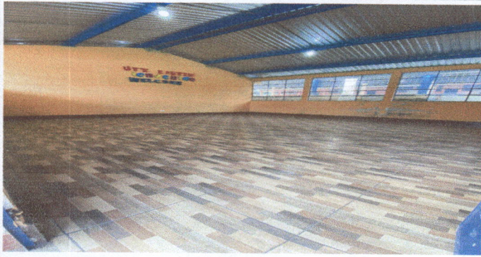
Foto1: finalización de azulejos en las aulas