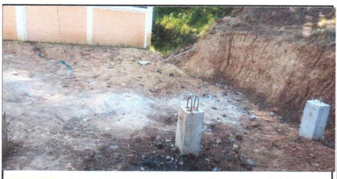
Foto 6: AREA DE CORREDOR DE COCINA EN NIVEL BAJO SE DEBE LEVANTAR UN MURO DE MAMPOSTERIA.

Observación: Si es necesario se pueden agregar hojas adicionales y actualizar el número de hojas.