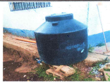
Foto 6: Reparación y mantenimiento de agua y sustitución de tubería.

Observación: Si es necesario se pueden agregar hojas adicionales y actualizar el número de hojas.