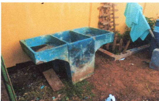
Foto1: Reparación y mantenimiento de agua.