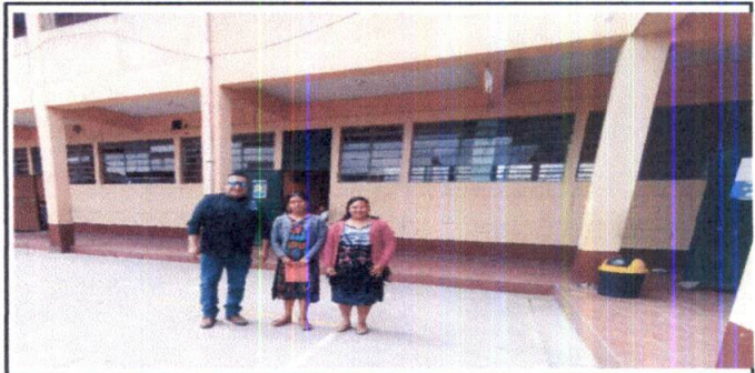
Foto 8: INGENIERO REALIZANDO EVALUACIÓN DE ESTABLECIMIENTO JUNTO A OPF Y DIRECTORA.