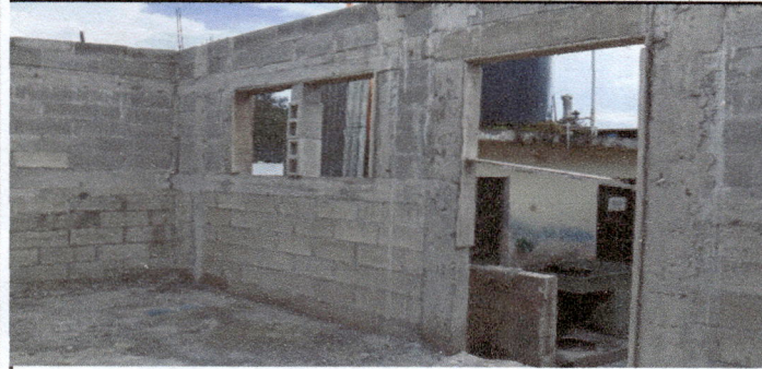
Foto 1: COCINA: Instalacion de puertas y ventanas, instalacion de electricidad