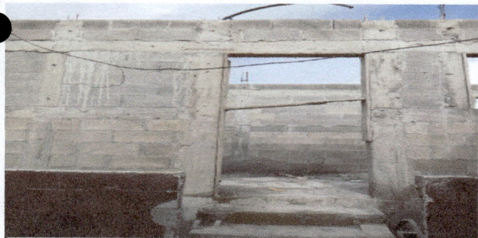
COCINA: Instalacion de canales,