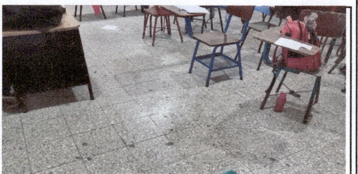
AULA: Colocacion de piso ceramico.

Observación: Si es necesario se pueden agregar hojas adicionales para actualizar el número de hojas.