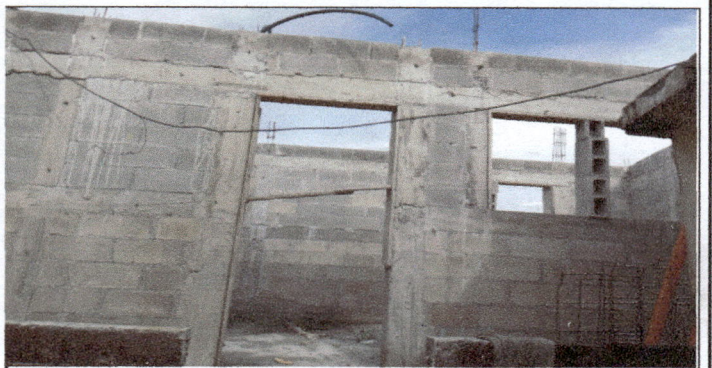
COCINA: Repello en el interior y exterior, iluminacion