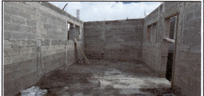
Foto 2: COCINA: construccion de un polleton , construccion de pileta, elaboracion de 4 mesas de concreto, colocacion de tuberia y drenaje