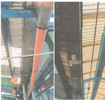
Foto3: canales y bajadas pluviales