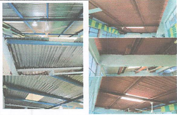
Foto 1 modulo de aulas