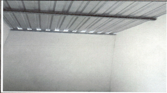
Foto1: Ampliacion de Cocina