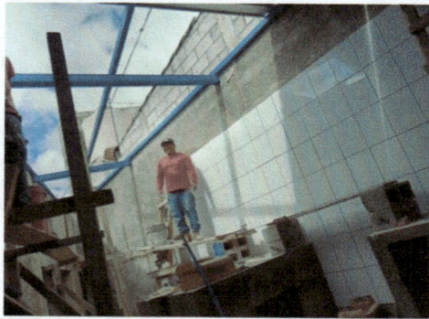
Foto1: TECHADO ÁREA DE COCINA