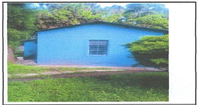
Techado de Pasillo frontal y colocación de piso de cemento, frente a la de cocina para área de reparto de alimentación escolar.

Observación: Si es necesario se pueden agregar hojas adicionales y actualizar el número de hojas.