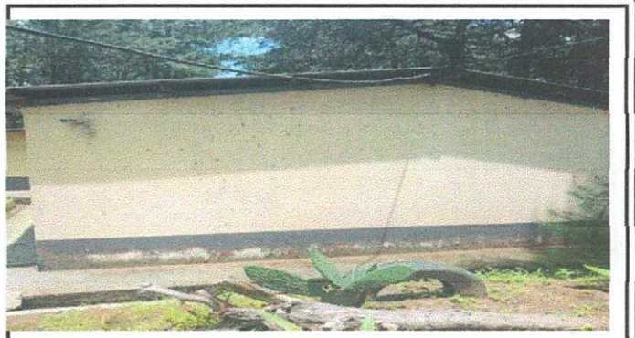
Se pintará todo el espacio que ocupa el aula, tanto por fuera como por dentro del mismo