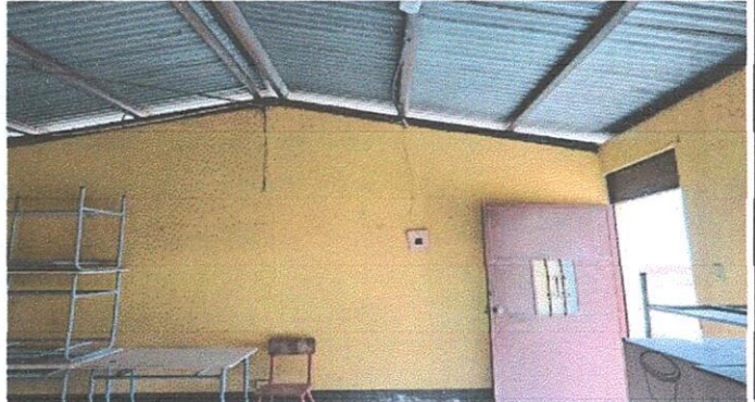
Se realizará instalación de energía eléctrica, tanto en tomacorrientes e iluminación.