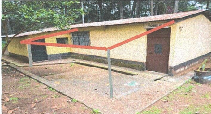
se colocará estructura portante de techo y lamina galvanizada calibre 26, para crear un pasillo de ingreso al espacio.