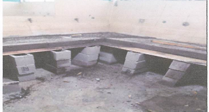
Foto 2: En este espacio se remozara la cocina y se hara un balcon en las ventanas.