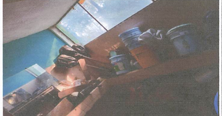
Foto 2: En este espacio se remozara la cocina y se hara un balcon en las ventanas.