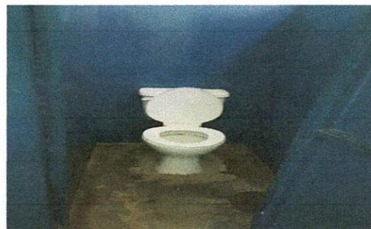
Foto 4: SANITARIOS DE NIÑAS, DONDE SE MUESTRA LA NECESIDAD DEL CAMBIO DE PISO.