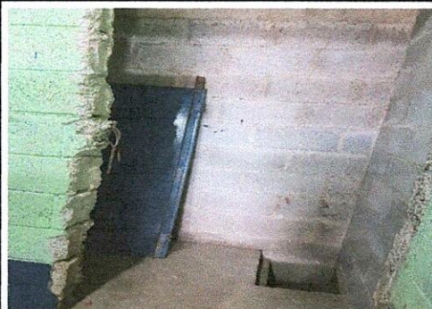
FOTO#1: MUESTRA UN ESPACIO DONDE SE PRETENDE INSTALAR UN ESPACIO PARA SANITARIO, TANTO EN EL ESPACIO DE NIÑOS Y DE NIÑAS.