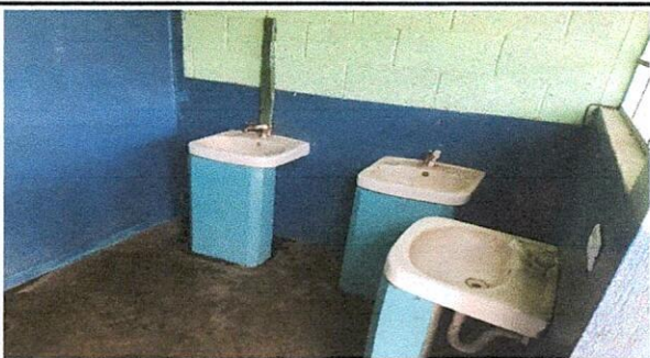
Foto 5: LA FOTOGRAFIA MUESTRA LOS LAVAMANOS LOS CUALES NECESITAN EL CAMBIO DE ESPACIO, PUES NO FUNCIONAN POR TENER LA TUBERÍA DAÑADA.