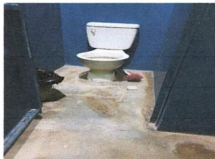
Foto 2: MUESTRA UNO DE LOS SANITARIOS DONDE SE VE LA NECESIDAD DEL CAMBIO DE LA PORCELANA SANITARIO.