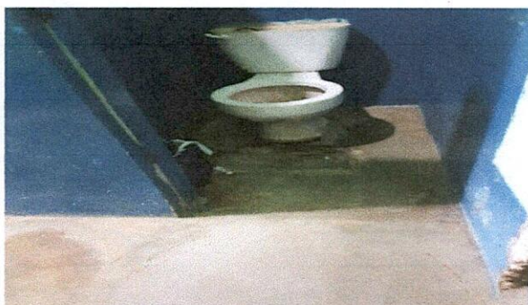
Foto 3: LA FOTOGRAFIA MUESTRA UNO DE LOS SANITARIOS DE VARONES DONDE MUESTRA LA NECESIDAD DE MEJORAMIENTO, DESDE EL AZULEJO HASTA LA PORCELANA SANITARIO.