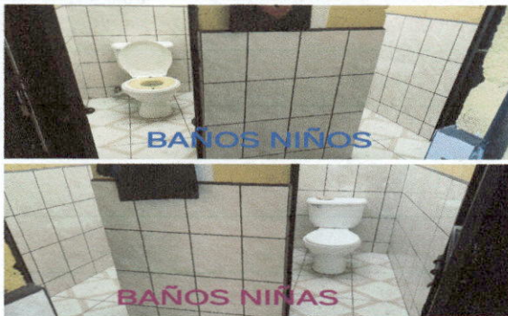
COLOCACIÓN DE AZULEJO Y PISO ANTIDESLIZANTE EN BAÑOS DE NIÑOS Y NIÑAS.