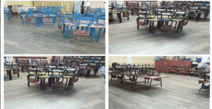
COLOCACIÓN DE PISO EN 4 SALONES DE LA ESCUELA.