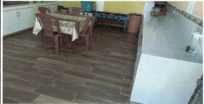
MEJORAMIENTO DE COCINA EN LA ELABORACIÓN DEL TOP DE CONCRETO Y COLOCACIÓN DE PISO.