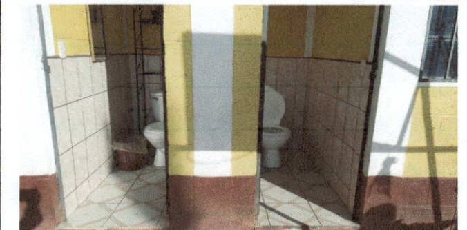
COLOCACIÓN DE AZULEJO Y PISO ANTIDESLIZANTE EN BAÑOS DE MAESTRAS.

Observación: Si es necesario se pueden agregar hojas adicionales y actualizar el número de hojas.