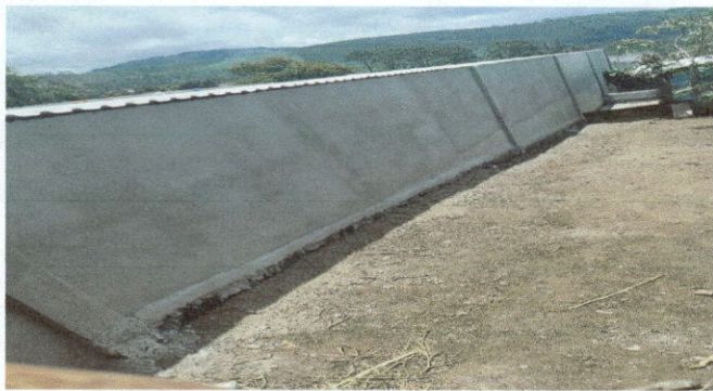
CERNIDO DE PARED DETRÁS DE LOS SALONES TRABAJO FINALIZADO