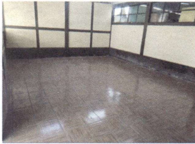
Foto1: Cambio de piso Aulas 1-3