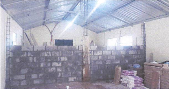
Foto1: DIVISION DEL SALON PARA COCINA Y SALON ATENCIÓN A PADRE DE FAMILIA.