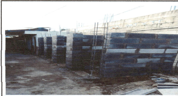
Foto1: Culminación de servicios sanitarios