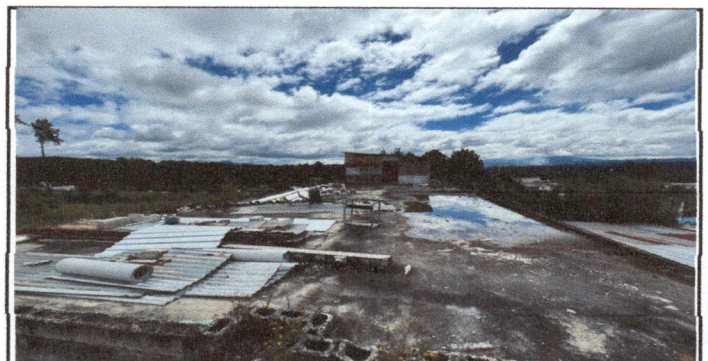
Foto 6: se necesita cernido en toda la orrila e implementar caída de agua para evitar estancamiento

Observación: Si es necesario se pueden agregar hojas adicionales y actualizar el número de hojas.