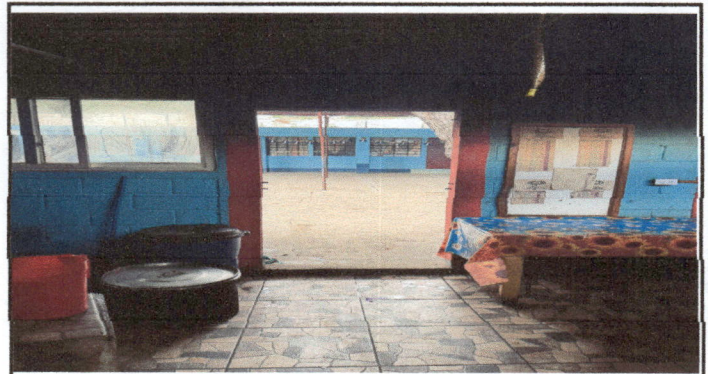
Foto 2: Adquisición de puerta y desayunador con fundición de cemento