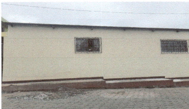
Foto 5: Culminación del repello de la parte de enfrente del establecimiento.