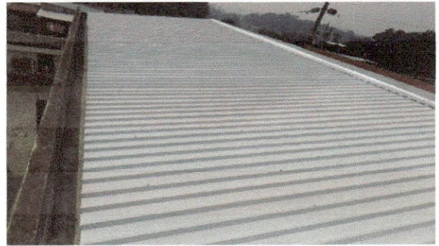
Foto 4: Entrega de los dos salones con el techado de láminas troqueladas.