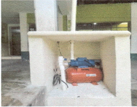
Foto1: Colocación de la bomba hidroneumática para la cisterna.