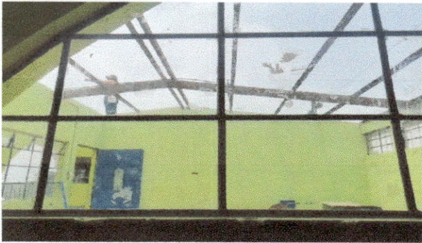
Foto1: Cambio de láminas de las dos aulas y corredor