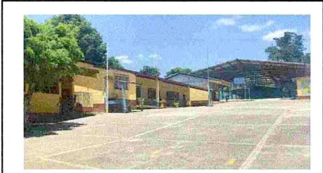
Foto 1: El centro educativo esta conformado por varios módulos actualmente