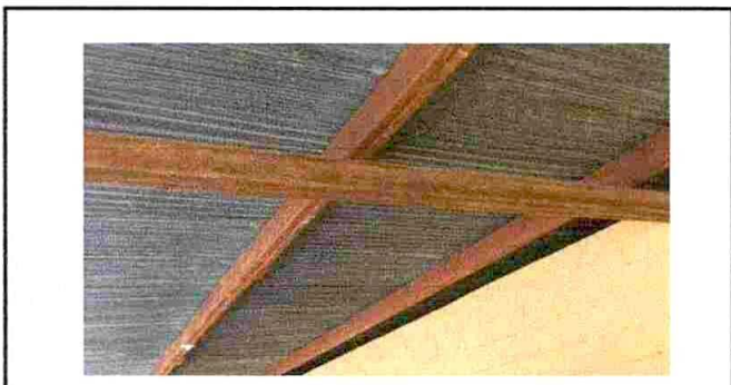
Foto 3: La cubierta de lámina permite varias goteras al momento de lluvia