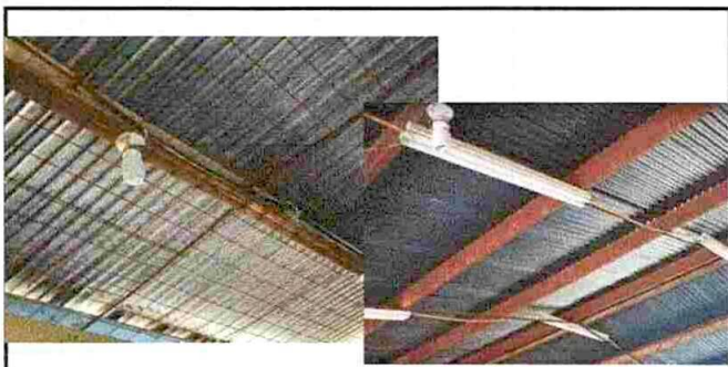
Foto 5: Las unidades de iluminación tienen la necesidad de varias reparaciones.