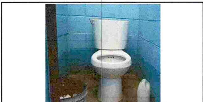
Foto 6: Varios sanitarios no cuentan con sus accesorios hidraulicos para su pleno funcionamiento.

Observación: Si es necesario se pueden agregar fotos adicionales y actualizar el número de hojas.