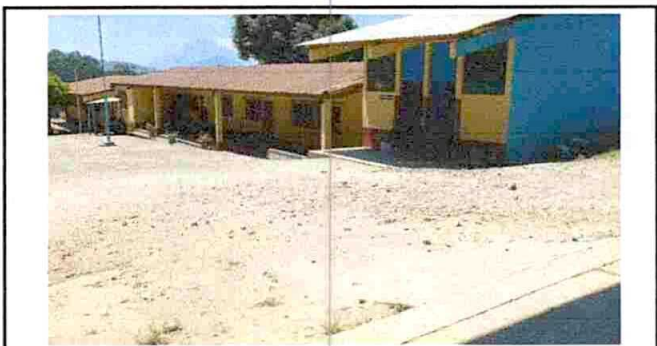
Foto 4: Necesaria la implementación de un piso de concreto con pendiente para que forme una rampa que permita acceder a la plataforma superior desde la inferior