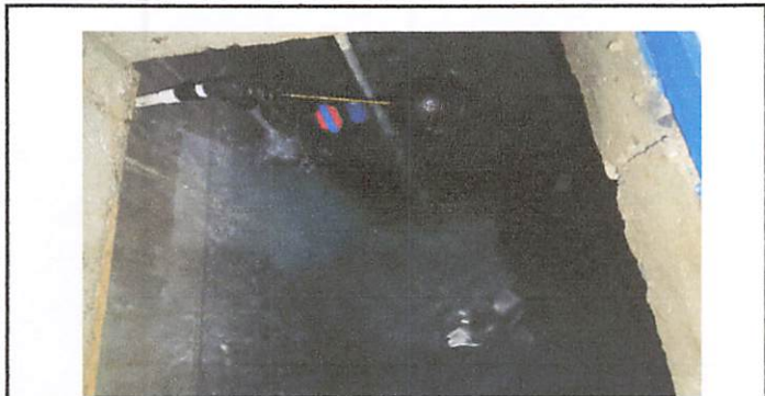
Foto 1: Área para construcción de cisterna subterránea 3X3X2.50 metros cúbicos