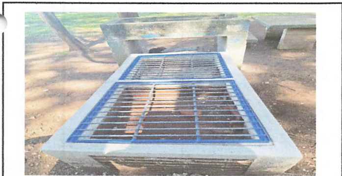
Foto 5: Elaboración de un poyo para cocina principal. Ver acta por cambio de lugar.