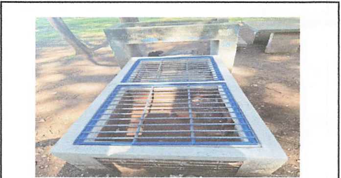
Foto 4: Elaboración de un poyo para cocina auxiliar. Ver acta por el cambio de lugar.