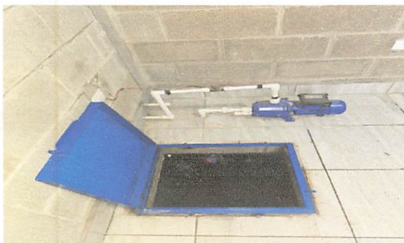
Foto 9: Bomba de agua ya instalada a la cisterna preparada para su funcionamiento.