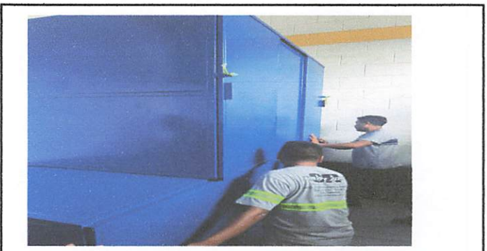
Foto 6: Pintura de 2 muebles y forrado de 1 de cocina para almacenamiento de alimentos no perecederos.

Observación: Si es necesario se pueden agregar hojas adicionales y actualizar el número de hojas.