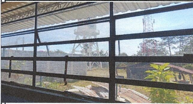
Foto 3: falta de balcones en salones para resguardo de material y equipo.